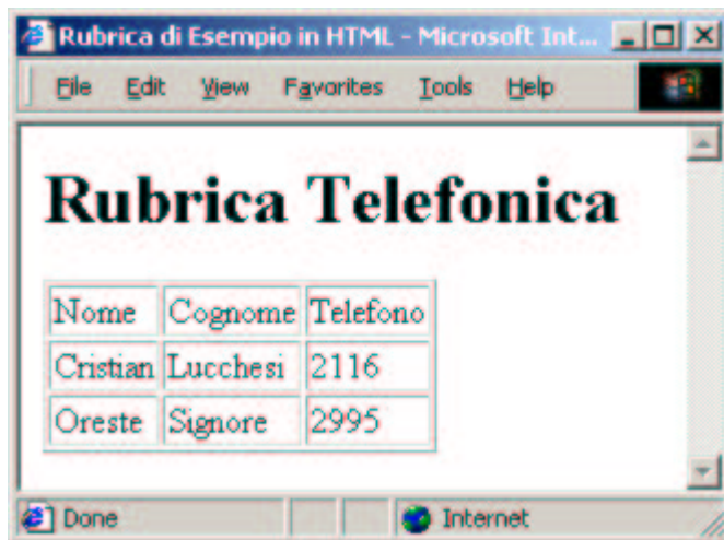
Figura 6 – La rubrica telefonica nella presentazione all'utente finale

Indipendentemente dalle caratteristiche del browser, la scelta se trasferire documenti con markup XML o trasformarli in documenti HTML (semanticamente