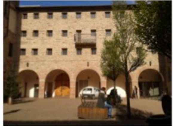
CC Valerio Signorelli