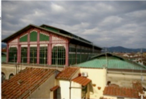
CC Mathieu Regnier